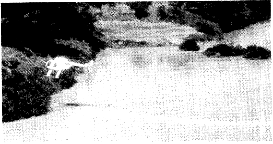
Fig. 9.2 Des hélicoptères sont utilisés, en Afrique de l'Ouest, pour répandre un agent biologique contre des simulies vecteurs de l'onchocercose (cécité des rivières).