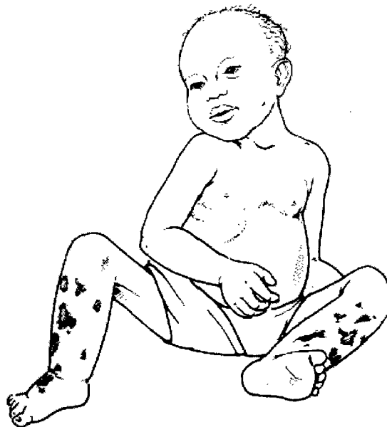
Ребенок с квашиоркором