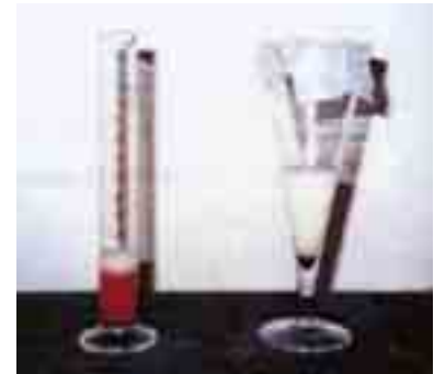
Hématurie et chylurie

Dans les régions tropicales et subtropicales où la filariose lymphatique est bien installée, la prévalence de cette parasitose continue à progresser. La principale cause de cette progression est l'expansion rapide et non planifiée des villes où pullulent les gîtes larvaires des moustiques transmettant cette maladie. La filariose lymphatique est une cause importante d'incapacité, de dévalorisation sociale, de diminution des possibilités qui s'offrent dans le domaine psychosocial et économique et un poids pour les ressources sanitaires et hospitalières, surtout du fait des coûts des interventions chirurgicales.