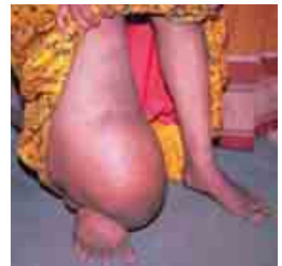
Eléphantiasis de la jambe

120 millions le nombre de personnes infestées dans plus de 80 pays tropicaux et subtropicaux