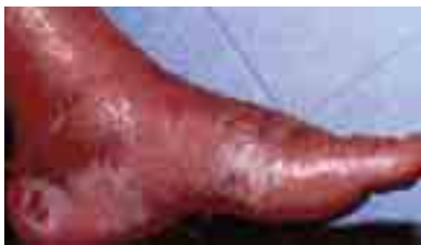
Signes d'un épisode inflammatoire récent: la peau pèle