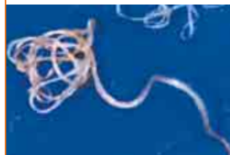
Macrofilarie à l'âge adulte