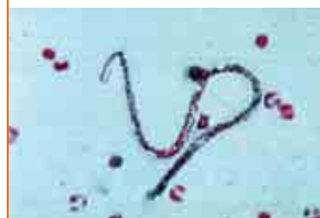
Microfilarie dans le sang

La filariose lymphatique est causée par des vers parasites filiformes que l'on appelle filaires.