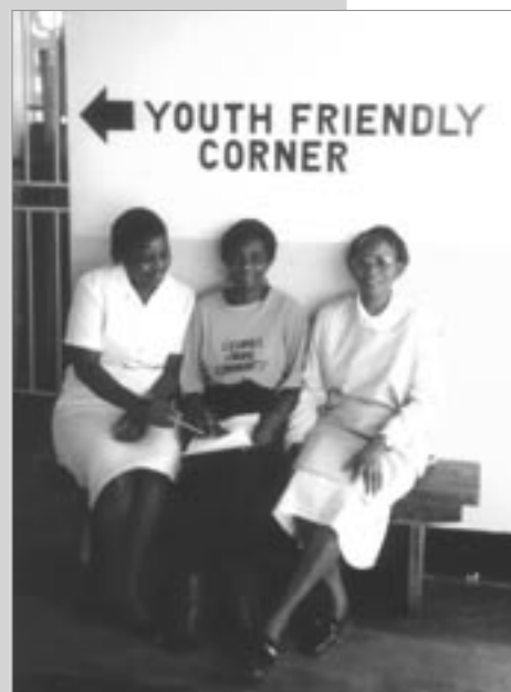
Le Centre d'accueil pour les jeunes au dispensaire de Bauleni.

Le rôle de ces services pour les jeunes dans le domaine de l'éducation sexuelle est l'une des fonctions les plus importantes, fait observer Isaac Sulwe de la ZNA. Traditionnellement, ce ne sont pas les parents mais plutôt les oncles et les tantes qui sont responsables de l'éducation sexuelle des jeunes, explique-t-il. Mais le SIDA et d'autres forces ont fait éclater la famille élargie, et laissé un vide s'agissant de la transmission de l'information, vide qui est comblé par des pairs dont les connaissances sont faibles et souvent imprécises.