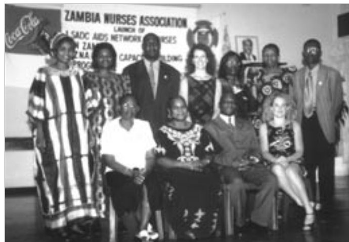
Atelier de formation des formateurs SANNAM/Baylor avec l'Association des Infirmières de Zambie, 3-6 septembre 2002.

De plus, une étude d'évaluation des besoins a été entreprise dans chacun des Etats membres. Elle forme la base de toute action future entreprise par le SANNAM pour permettre aux infirmières et aux sages-femmes de la région de répondre plus efficacement à l'épidémie de VIH/SIDA (voir Annexes 1 et 2).