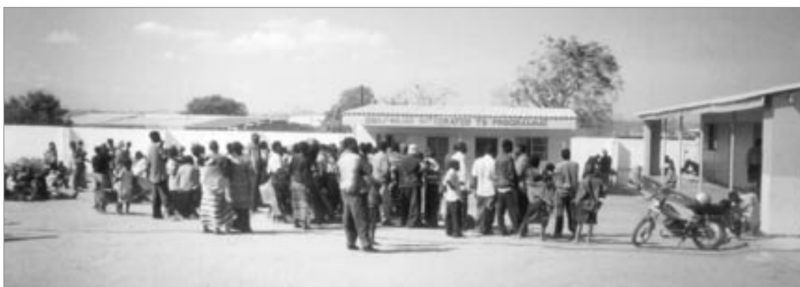
Les programmes antituberculeux de Bwafwano fournissent un service indispensable dans la communauté.

recherche d'un soutien de donateurs pour une variété de nouveaux services. Aujourd'hui, Bwafwano organise un programme de formation de compétences qui enseigne la couture, la menuiserie et le tissage des tapis ; un programme d'alimentation qui s'occupe tous les jours d'environ 200 enfants ; un dispensaire ; et un centre de jeunesse. Il y a également une école pour plus de 220 orphelins et enfants vulnérables. Lorsqu'on s'est aperçu qu'une grande partie des enfants ne pouvaient pas se concentrer en classe, Beatrice Chola a engagé un travailleur social pour donner des conseils psychosociaux. Très souvent, explique-t-elle, les enfants ne s'entendent pas très bien avec leurs tuteurs, qui sont fréquemment submergés par les bouches supplémentaires à nourrir. Si cela est possible, le conseiller parle à tout le monde ensemble. Grâce à la variété des ressources et des compétences rassemblées, Bwafwano offre maintenant aux familles touchées par le VIH/SIDA un ensemble comportant trois éléments, qui consiste en soins pour les adultes malades, soutien de pairs pour les enfants adolescents du foyer offert par le groupe de jeunesse de l'organisation, et soins pour les petits enfants.