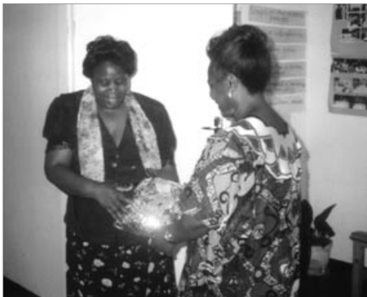
Célébration du partenariat entre la ZNA, l'Association norvégienne des Infirmières et la NORAD pour le projet de soins VIH/SIDA à l'intention des soignants pour les infirmières et sages-femmes.

le projet VIH/SIDA, en demandant l'aide de l'Association norvégienne et du Gouvernement norvégien. L'objectif de ce projet, financé par la NORAD et l'Association norvégienne des Infirmières, consiste à donner aux infirmières et sages-femmes des informations essentielles sur le VIH/SIDA, à développer leurs compétences en matière de prise en charge clinique ainsi que de prévention de l'infection à VIH, et de lancer un défi à la stigmatisation et au silence en encourageant les infirmières et sages-femmes à rechercher un CTV, et à offrir un soutien quel qu'il soit à ceux qui sont infectés.