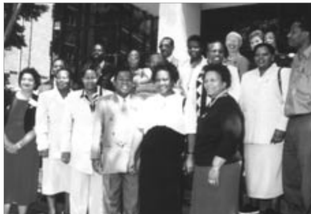
Membres du SANNAM de 14 pays de la SADC, avec leurs supporters de la SADC et de l'ONUSIDA.