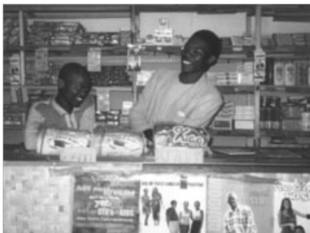
Ce kiosque d'épicier dans le compound de Chipata, à Lusaka, sert de centre d'accueil au programme du Groupe pour la jeunesse de Bwafwano pour la distribution de préservatifs et d'informations sur le VIH/SIDA à la communauté.