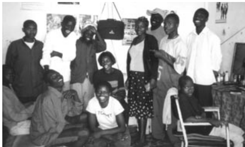
Membres du Groupe de jeunesse Bwafwano.